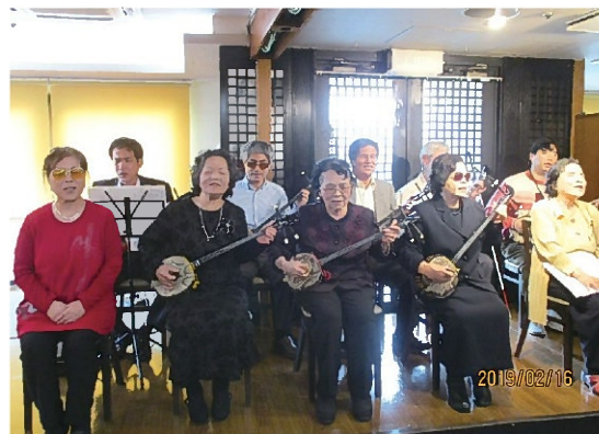
写真は2019年の新年会の様子です。

沖縄県網膜色素変性症協会(JRPPS沖縄)からのお便り 「新年カラオケ親睦交流会」のご案内