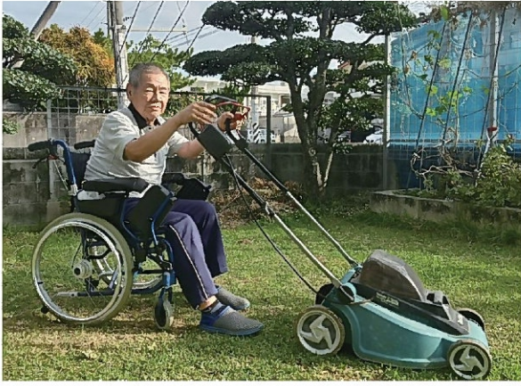
庭の芝刈りもお手の物。車椅子でも問題なし！