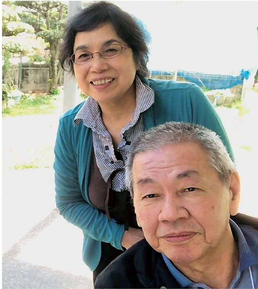
妻の助けを借りながら、日々の生活を楽しんでいます。

「表誌は語る」への投稿は今回で2回目になります。私の病名は孤発性の脊髄小脳変性症で、身体障害者手帳2級を所持しています。