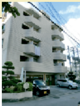
駐車場4台 事務所正面と駐車場

最寄のバス停（姫百合橋）◆30番 泡瀬東線 ◆31番 泡瀬西線◆55番 牧港線一開南經由 ◆56番 浦添線一西原折り返し ◆56番 浦添線一浦西団地折り返し ◆112番 国体道路線