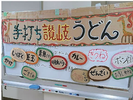
いつも持ち歩いている全11種類のうどんメニュー

歩き、1年ほどしたら現地で作り方を教えてもらえる機会がありました。不思議とすんなり香川のいりこ出汁ができるようになり、病氣のお友達が長期入院している筋ジス病棟まで、出張うどんに車で出かけるようになりました。月に4000キロ程乗っていたようです。とても喜んでもらえるのが嬉しくて、笑顔が見たくて、いろいろな繋がりの仲間達と、それこそ会社が休みの毎週末に出張うどんをするようになり、北は北海道から南は沖縄まで、果てはジャカルタやシアトルでもやりました。このお盆にはナミビアでうどんを広めてくることになっています。 人生、何が転機になるのかわからないものです。「あと4、5年で」といわれて、18年がたちました。孫も2人できました。それにしても、先生の見立てが悪かったようです。讃岐うどんを食べていると、体内にウドニンというアミノ酸ができてそれで筋肉が再生しているのだ、讃岐うどんの生地を踏んで、踏んで作っているから筋肉が再生し