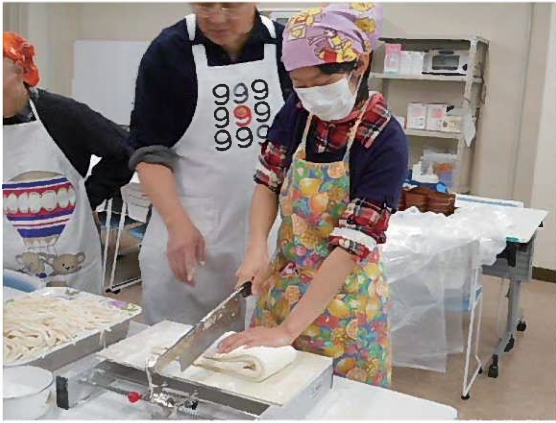
今年1月、伊丹でボッチャ仲間(障害者団体)とのうどん会

「このままの生活していたのでは、すぐに車椅子だ」と思い、子供が中2と小4だったので、ちよつと家族と別居して、会社の近くに引越しをし、好きなように生活して、行きたいところに出かけて、やりたくない仕事は人にまかせ、なるべくストレスから遠ざかるようにしました。