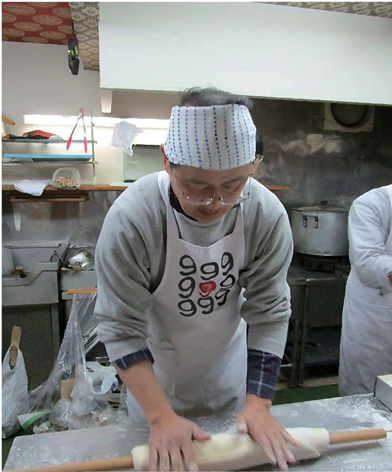
うどんは棒に巻いて体重で伸ばします。

「あと4、5年で車椅子ですね」と、筋生検の結果を主治医から告げられたのが、38歳の時でした。後ろに両親がいたのですが、す