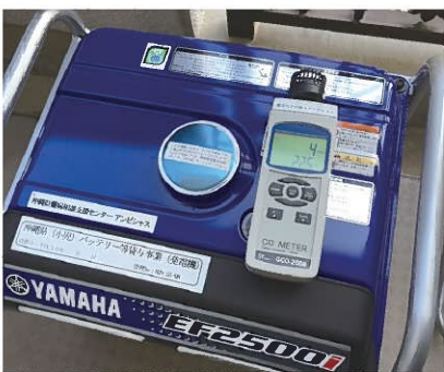
貸与発電機運転中の 一酸化炭素濃度を計測中

最近3・11の報道も多くなり、防災の意識も高まっているので、備えあれば憂いなしです。