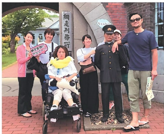
今年8月北海道旅行時の一コマ。

うことはあるが、無知な私にはまだまだ分からないことのほうが多い。ただ私の経験でお話しする以外方法が見つからないのが事実だ。私が発症した頃と比べ、今の時代がうらやましい。今は気になる症状やキーワードを検索すればポンとすぐに調べたいページが出てくる。そんな情報社会と助けてくれる福祉機器のおかげで私たちのような難病患者の暮らしは、私が発症したころに比べても随分暮らしやすくなったと思う。