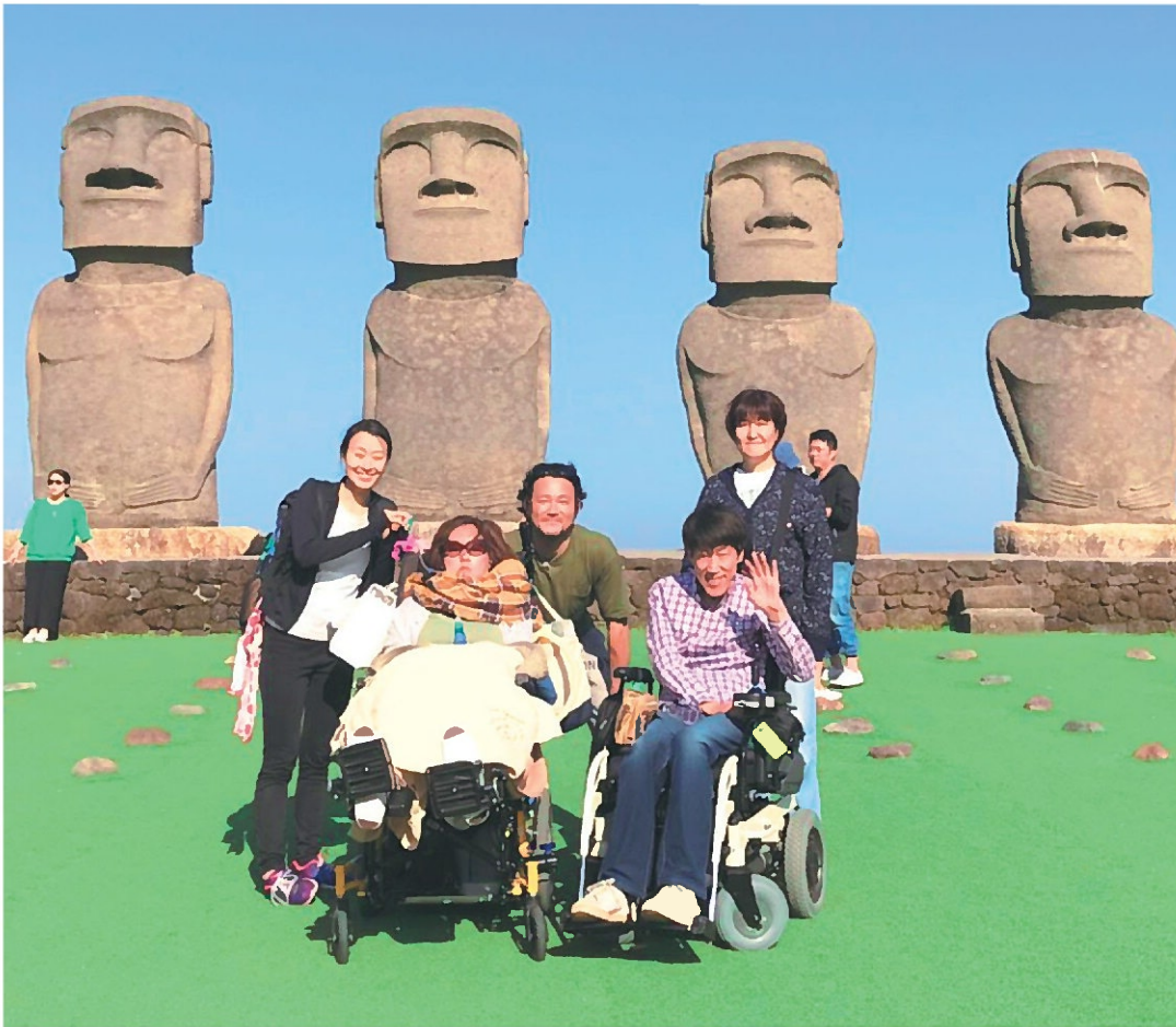
宮崎県サンメッセ日南のモアイ像をバックに。

発症からしばらくの間、「私は何のために生きているのだろうか」と考えている時期があった。