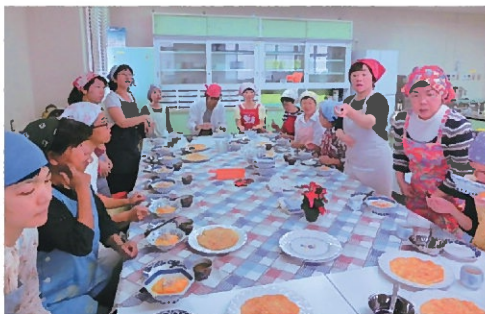
昨年までの調理実習風景