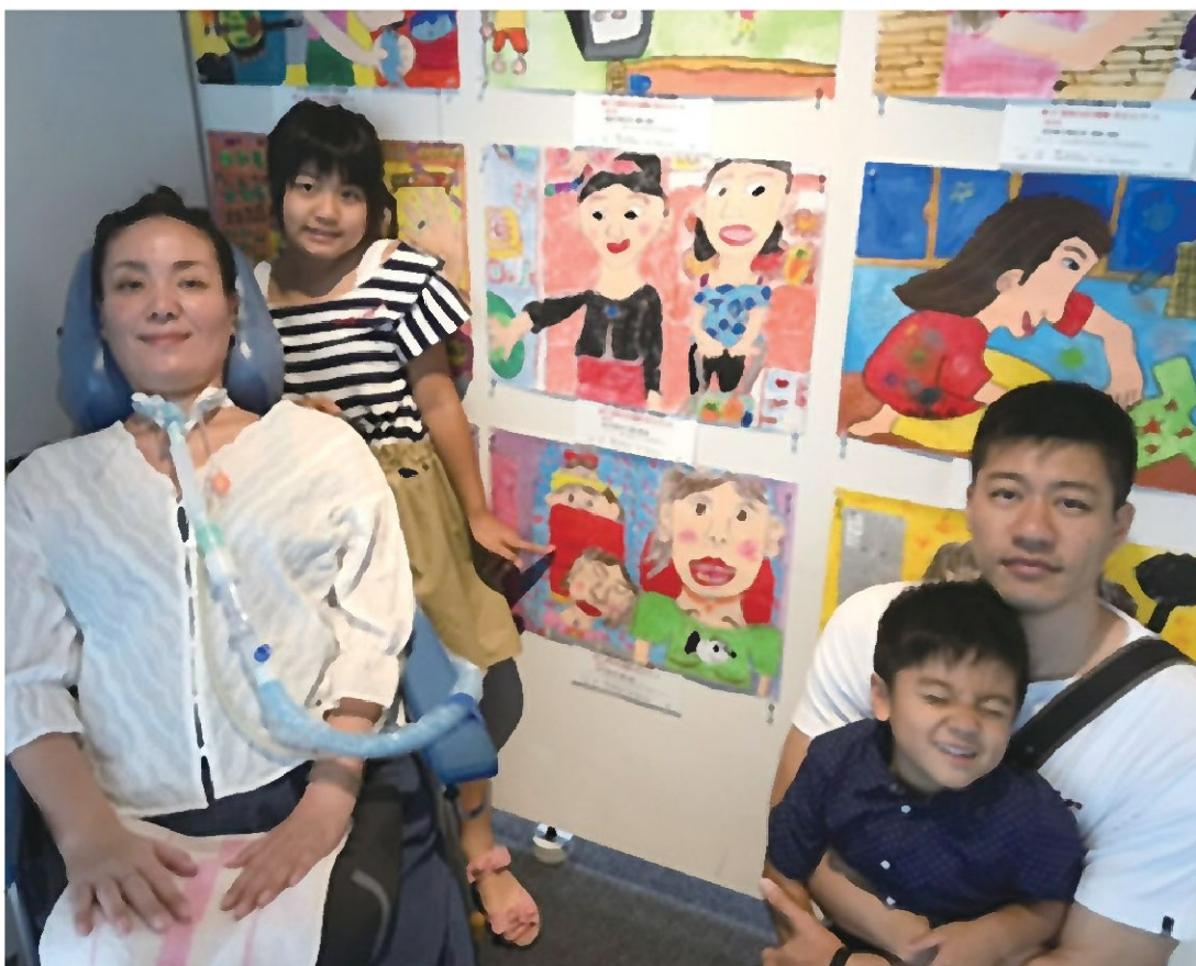
2019年母の日の図画コンクールで娘が優秀賞に入賞した展示会での一コマ (娘が指している作品)

2016年6月下旬、私の体に異変が現れる。疲れやすさ、力が入りにくい感じで左腕の上げづらさ、首のつりを感じるが四十肩かなと思えばしばらく様子を見ることにしてみました。しかし症状は良くなり整形外科を受診、レントゲン検査、CT、MRI検査を受けるもどこにも異常はなく、診断付かず沖縄病院へ紹介されて10月に検査入院、左腕の筋力低下以外は問題なしと言うことでこれと言った診断は付かず、経過観察で月一回の定期受診になりました。