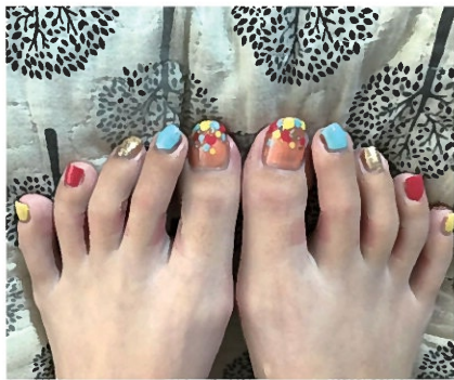
見本画像をLINEしてヘルパーに塗ってもらったペディキュア

るのかを問われました。その問いかけは医療者からしたらごく普通の事で、今後どう物事を進めサポートしていくかを決める為に必要な問いかけだと、今ならそう思います。当時の私にはただ恐怖でしかありませんでした。