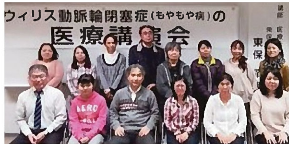
今年1月実施の講演会より

もやの会沖縄県ブロックより 「ウィリス動脈輪閉塞症(もやもや病)医療講演会」 のご案内