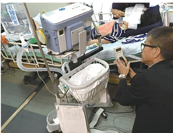
人工呼吸器の消費電力を計測中

アンビシャスでは補助事業として沖縄県から委託を受けている非常時電源確保事業と並行して、