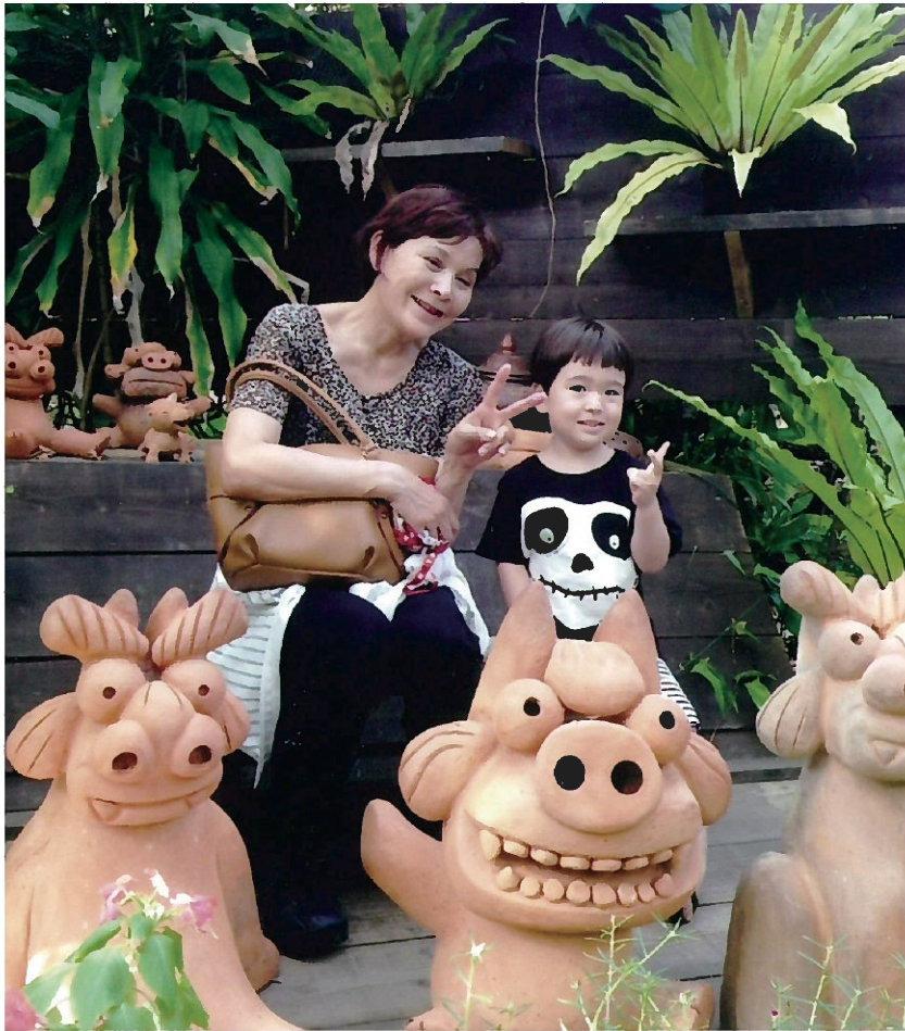
かわいい孫と(もう一人孫娘がいます)

私は現在、原発性胆汁性胆管炎と全身性エリテマトーデスの難病の他、ぶどう膜炎もあり治