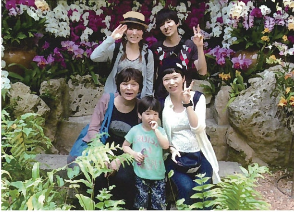
ビオスの丘にて孫と子供たちに囲まれて

少し気を紛らわせていた様な気がします。性格としては、いつも前向きに考えるのは良いところですが、負けず嫌いで何事も自分の考えだけで決めてしまうところがあり、お医者さんを困らせたことも有ります。