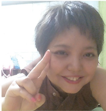
以前はカーテンを開け日差しを浴びていました。

念のためツベルクリン検査をしました。その結果、強い陽性反応が出たため結核の検査をしました。結核の反応はなく、医者からは膠原病かも知れないと言われました。そこで膠原病の検査もしましたが、膠原病は5項目の検査に当てはまらないと確定出来ないらしく、私はそのうちの3項目だけがあてはまり、難病指定はされませんでした。医者から「難病の指定は出来ないが、いつ発症するかもしれないのでしばらく様子を見ましょう」と言われ、その後の治療は無くなりました。それから、たまにくる倦怠感や40度を越える発熱と、体調は悪くなる一方でした。