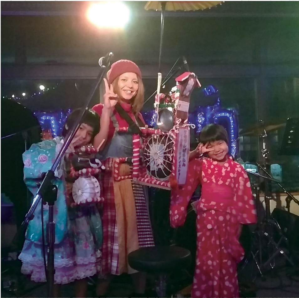
SLE発症前、ライブ会場で娘たちとチンドン屋に扮した時の様子

私は現在、全身性エリテマトーデス(SLE)と言う難病を持っています。無職で年齢は39歳です。