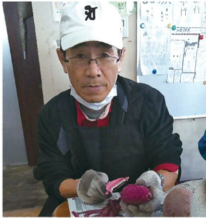
職場にて芋むき作業中

生活となりました。入院中は食欲もなく、食事以外の時間は何もせずにつと横になっていました。そんな中で考える事はいつも家計の事ばかりで、診察のたびに「家が心配だから早く退院したい」と訴えていました。そのような入院生活も終わりに近づいた頃、弟が私の手の震えに気づき担当医に伝えると、パーキンソン病の疑いがあると診断されました。あいにく、その病院は専門外だったため、他の神経難病専門の病院を紹介してもらいました。パーキンソン病の治療のため現在もその専門病院へ12週に1回の間隔で通院しています。