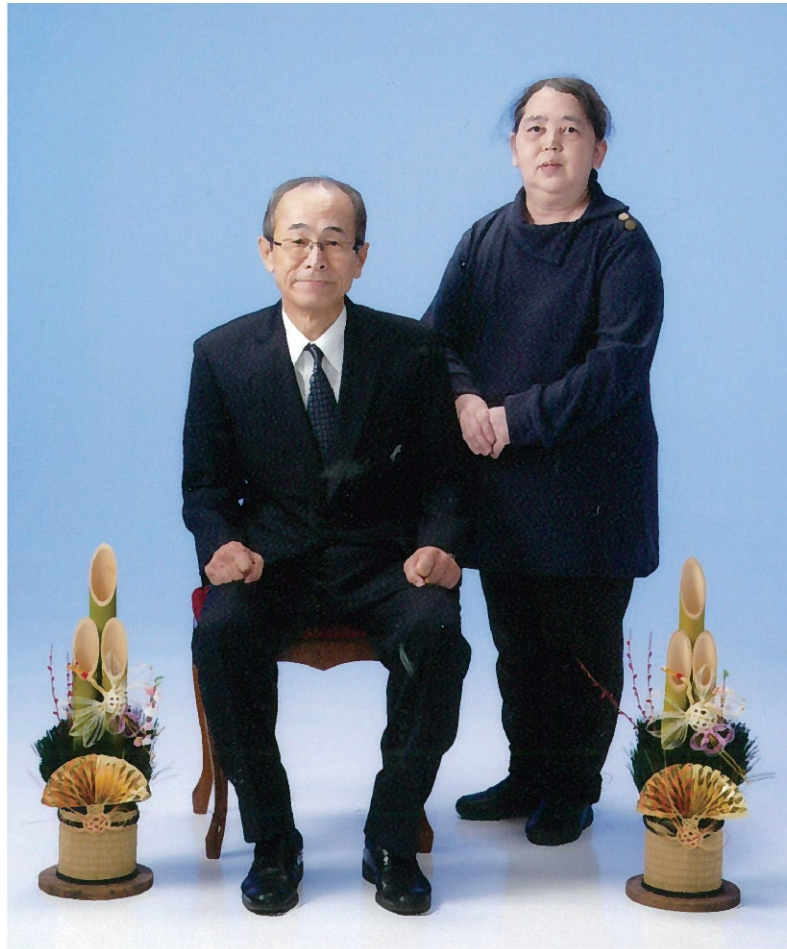
永年苦勞を分ち合った妻と正月(今年)の記念撮影

世の中に赤坂、桜坂という名はあれども「まさか」という坂に見舞われるとは夢にも思いませんでした。