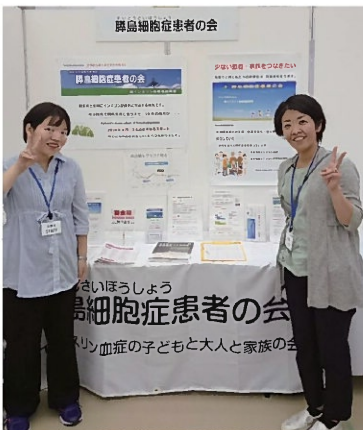
小児内分泌学会学術大会患者会

そんな日々の中、子どもたちの病気はとにかく患者数が少なく何か情報はないかという思いからブログを書き始めました。そして、SNSでも情報を探しました。しばらくしてからブログを通して同じ病気の方と同じ病気の子どもの親御さんに出会うことができました。ネット上の繋がりがだけな