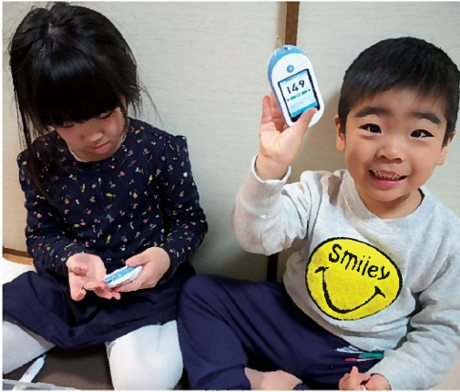
指先にチク！血糖値の測定も白分たちで出来ます。

ど、起きてこない。何かおかしいと感じて息子の血糖測定器で血糖値を測ると、21mg/dlと非常に低く、急いでジュースを飲ませて様子を見てみるとみるみるうちに喋りだし、踊りだしました。あの時、そのままにしていたらケイレンを起こしたり、意識を無くしていたかもしれない。意識を無くしてしまうとゾツとします。そして当時娘は幼稚園入園が決まっております。幼稚園入園が済んでおられるか「お菓子の管理は園にお願いできるのか」など目先の不安も大きかったです。それ以上「今まで気づくことができなかった」といふ思いが、息子の病気が分かった時の気持ちとは全く