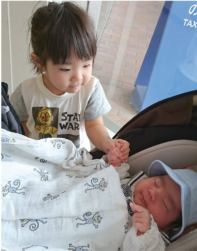
息子の退院口、1か月ぶりの対面にお姉ちゃんも嬉しそう!

3年と少し前、「3990!」 3990!と、病院の手術台 の上で看護師さんに叫ばれた時。 それが私の中で未知の世界のス タートでした。