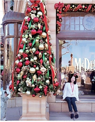
プロポーズされた思い出の ディズニーリゾートでの一コマ