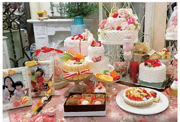
本物そっくり、美味しそうなスイーツデコ

治療中に出会った*「スイーツデコ」のおかげで気持ちを持ち直し、家族のサポートを受けながら県外のレッスンへ通い、高校卒業後から現在にかけて自宅で教室を開催しています。数年前にはシェーグレン症候群を併発しました。この病気は涙腺や唾液腺などの外分泌腺に慢性的な炎症が起きるものですが私の場合