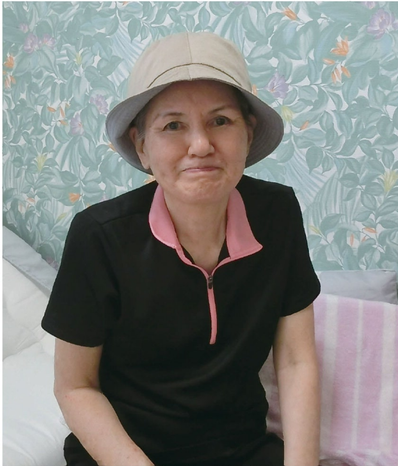
新しい部屋は快適です。