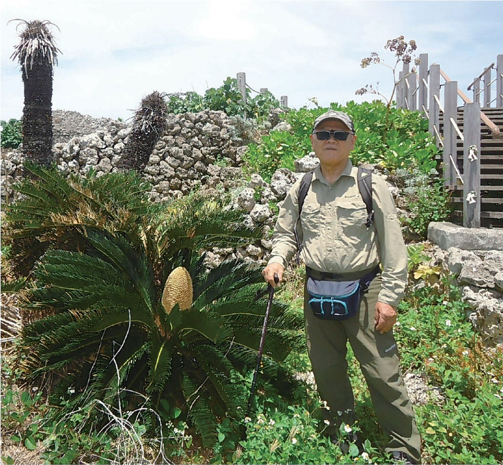
趣味の城跡巡りをヘルパーさんの力を借りて再開!(写真は具志川城跡)

夢を取り戻すには「もう遅いかな」と言ったら、誰かが「全然遅くないよ」と言ってくれた。有難い言葉です。