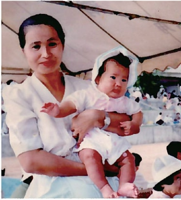
お兄ちゃんお姉ちゃんの運動会にて、 当時3か半月の3女との2ショット。