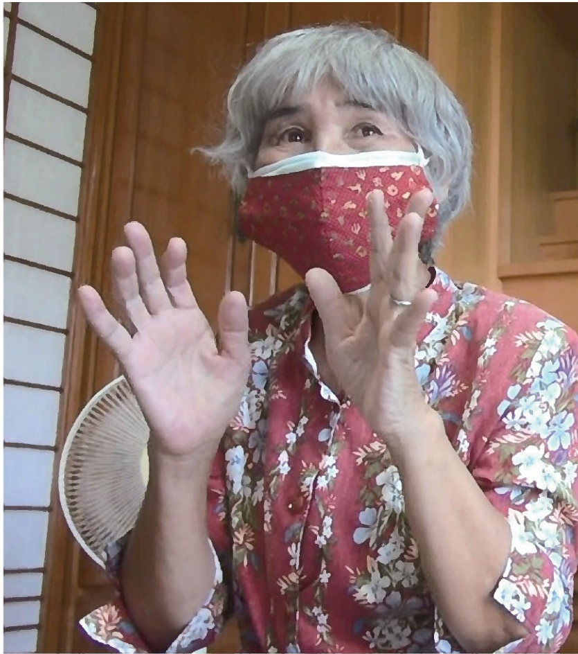
取材に身振りを交え思いを語る赤嶺さん。