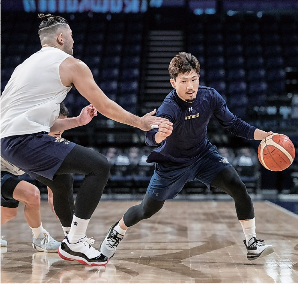
実戦さながらの練習風景。