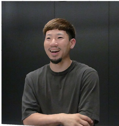
取材時の質問に思わず笑みがこぼれる。