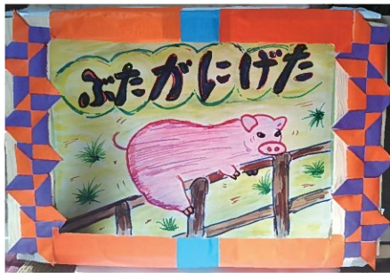
子ども達と作った紙芝居「ふたがにげた」。

ントされた万歩計を付けウオーキング人生がスタートしました。診察が終わると一日1万歩は当たり前、2万歩を超えた日には医師から「歩き過ぎ」と注意されました(笑)。