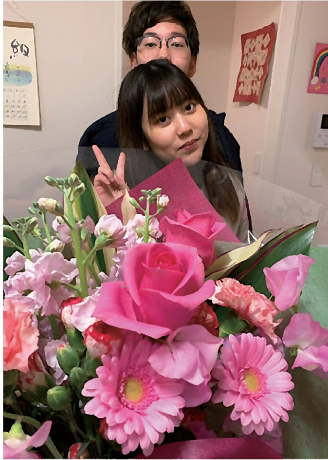
2歳違いの姉弟(娘の存在は私にも息子にも大きいものがあります。)