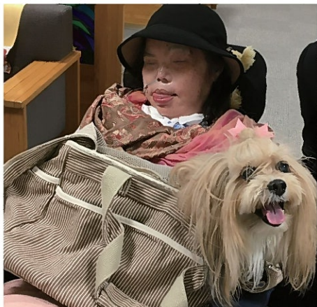
常に行動を共にした唯一の家族「ポンちゃん」。