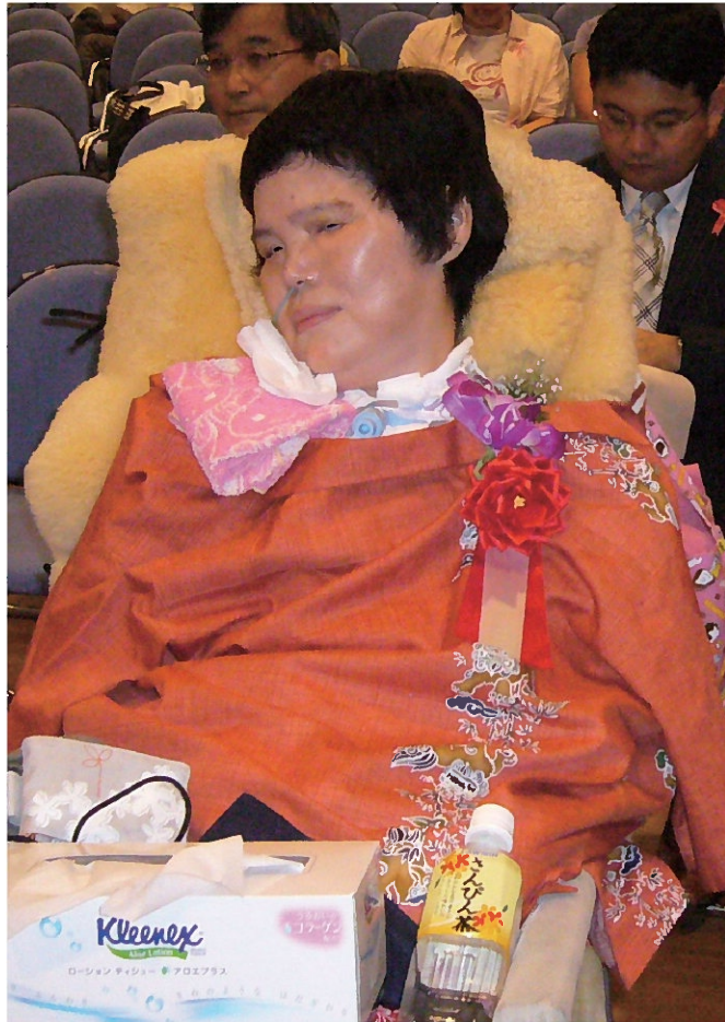
日本ALS協会 総会時の一コマ。

あなたがALSと告知されたら しつかりハッキリなさいませ あなたがALSでも、 そうでなくつても きつと明日は来るのだから しつかりなさいね大人でしょ 強くなれとは言いません でも甘えてはいけません