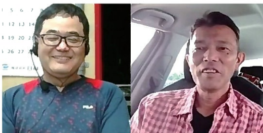
友の会では少数派の「男子会」(停車した車の中から参加)