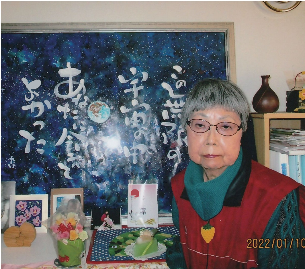
バックのアクリル画は障害のある方の展示会で感動し即注文したものです。

遠い記憶の中で、そこはクレゾールの匂いのする、朝日が差し込む明るい部屋だ。目の前に白衣のお医者様がいる。処置台の上には、ガラスの注射器が置いてある。