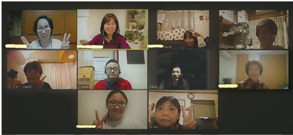
クリスマス&忘年会の様子(写真) ゲーム風自己紹介、ビンゴゲームで盛り上がりました!!