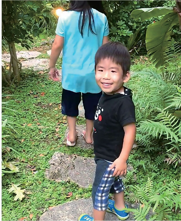
家族で散歩している時の一場面。

皆様はプラダー・ウイリ症候群（以下、PWS）をご存じでしょうか。出生児の約15000人に1人程度発生する先天性の疾患で、新生児期の筋緊張低下および、哺乳障害、幼児期からの過食と肥満、発達遅延、低身長、性腺機能不全などを特徴と