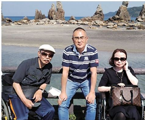
LINEグループH&amp;P 3名の運営メンバー

いた覚えもあります。「中年だし運動不足だから仕方ないな」くらいに思っていました。