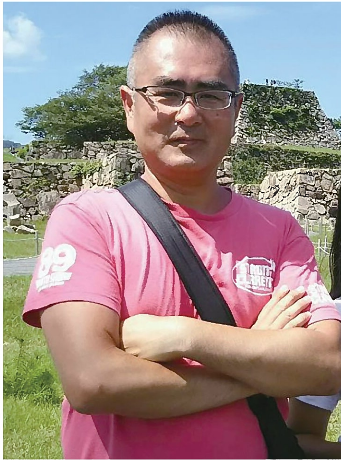
これからもいろんな所を旅したいです。

僕が「表紙は語る」に投稿するきっかけとなったのは、次のようなアンビシャス様との出会いからでした。