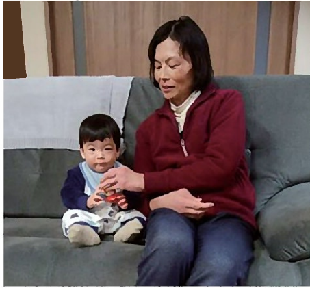
家族が増えて賑やかな今年の新年です。

SLEと鬱による不調に心身共に辛く暗い毎日が3年続き、このままでは自分が駄目になると、SLEによる体の痛みはありましたが、無理矢理に体を動かし続けました。何かしていないと気がおかしくなりそうな状態でした。