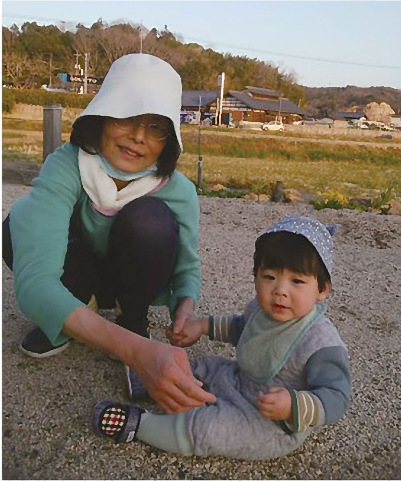
外歩きデビューしたばかりの頃、子どもと砂で遊びました。

病気でない人生を送りたかった。そう強く思ってきました。今までの苦しく辛い日々を思い出すだけで涙が出ます。勉強が好きだった