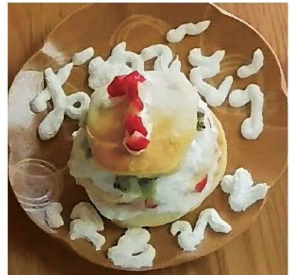
3月に1歳の誕生日を迎え、離乳食中のため砂糖・生クリームなしのケーキを作りました。

免疫というものは複雑だそう、すぐに良くなるわけでもありません。自分の将来を考えると、親がいなくなつた先のことが不安で仕方ありませんでした。まずは経済的な事を考え結婚しなければならぬと思いました。これまで病状を良くすることだけを考えていましたから、結婚相手を見つける心の余裕がありませんでした。しかし不安に襲われ、その不安を打ち消すには行動しかありません。「人は幸せになるために生まれてくる」という信念の仲人さんとの出会いがあり、まずは人柄を知ってもらおうこと、病気があることは仲人から話しますと。その仲人さんの仲立ちで良縁に恵まれ36歳で結婚しました。両親も泣いて安堵