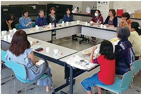
2019年6月29日のコロナ前医療講演会のあとの交流会の様子