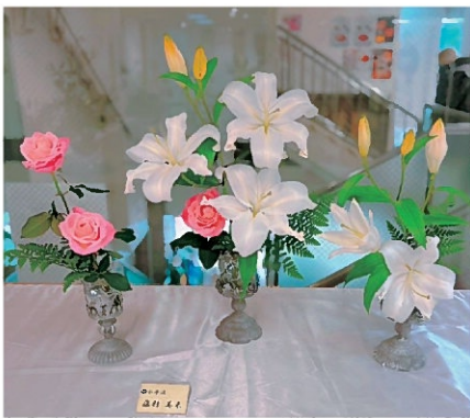
小原流いけばな社中ミニ花展にて、大好きな薔薇と百合の作品を出展。