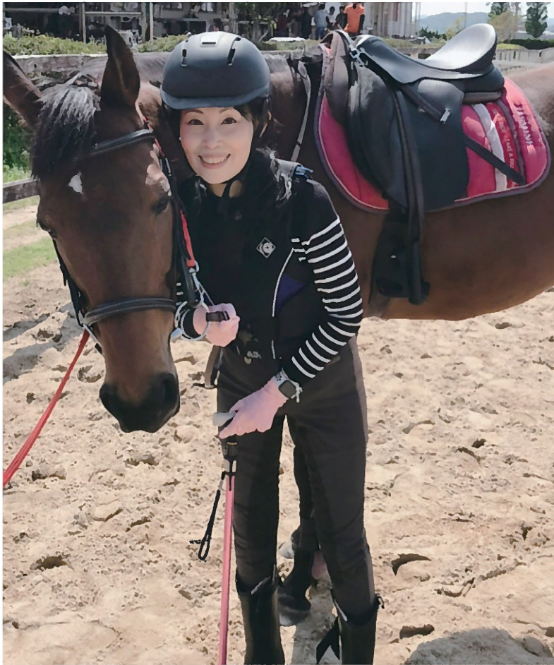
障がい者馬術を始めた頃、干拓の里馬事公園にてジャスミンちゃん。

目覚めると、体が思うように動か かせず起き上がれないという約20 年前の朝が、忘れられない発症記 念日です。当初は線維筋痛症と診