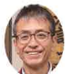
通 名喜照 著

そのような折に、膠原病友の会沖縄県支部長に連絡しても連絡が取れなかつたので、保健所に問い合わせたら彼はご逝去されてしまいました。その時、悲しみ、難病に対する怒りを感じ、難病を恨みました。難病に復讐してやる。復讐のやり方としては、難病になつても自分らしく生き、夢や希望を追いかけること、それを支えることがその方法であり、アンビシャスの使命だと考えています。まだまだ充分な活動はできていませんが、皆さまのご支援とご鞭撻をお願い申し上げます。