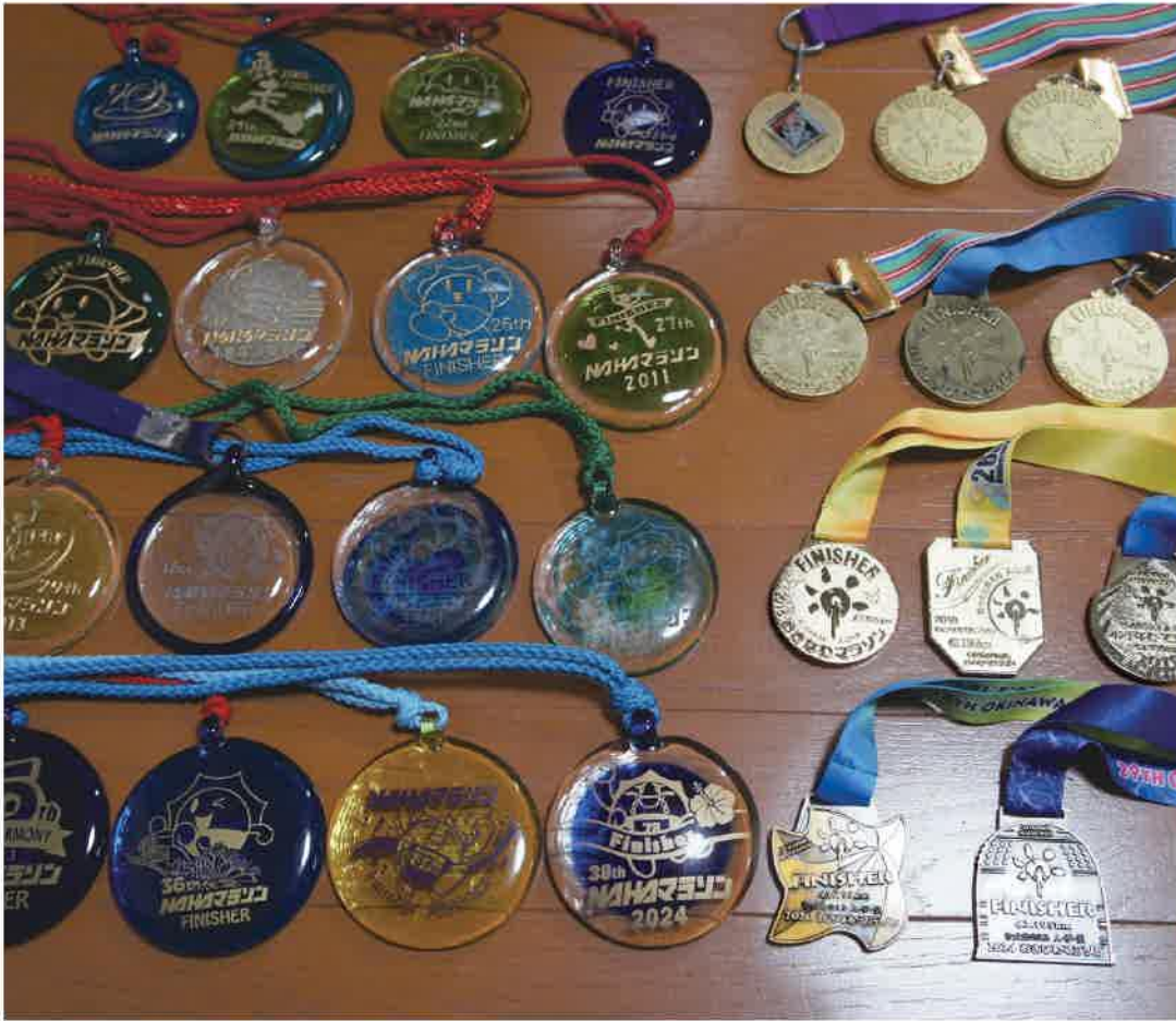
これまでもらったNAHAMラソンとおきなわマラソンのメダルです

私は患者歴36年のクローン病患者です。健康のために始めたジョギングにハマり、病気と付き合いながらフルマラソンを完走するまでになった経緯を紹介します。