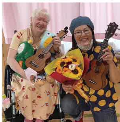
初めて人前でウクレレの弾き語りをした後にウクレレの先生と

アルビノは、ヘルマンスキー・パドリック症候群(HPS)という難病を併せもつ場合があり、指定難病に入っていますが、難病登録をしていない仲間もたくさんいます。しかし、アルビノ