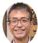
通 喜 照 著: 照喜名 通

また、医療費のほとんどは税金で賄っているので税金の無駄使いと言われてしまいかねません。患者の言うことをただ鵜呑みにしすぎる医師にも問題がありますし、外来の短い時間での患者と医師との関係性を構築することは難しいです。 患者側のヘルスリテラシーの向上の研修会などアンビシャスができることないか模索中でありま。