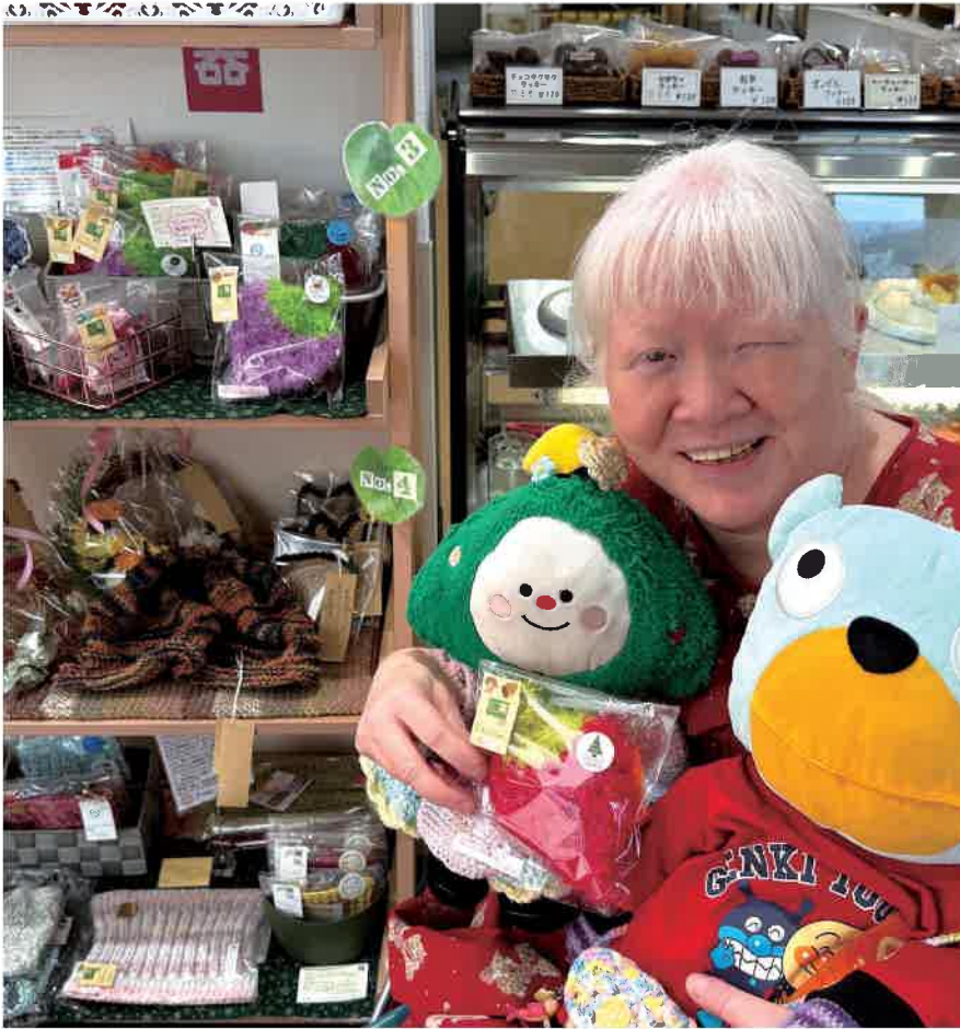
百里石嶺町にあるcafeわきみずのレンタルスペースに常設

病名のことを始めに紹介します。正式名称・登録名称は眼皮膚白皮症です。通称はアルビノで通りま